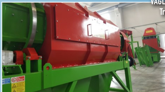
VAGLI ROTATIVI Trommel